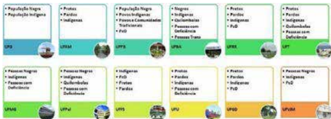
Quadro 2 - Grupos de interesse das ações afirmativas em Universidade e Institutos Federais)