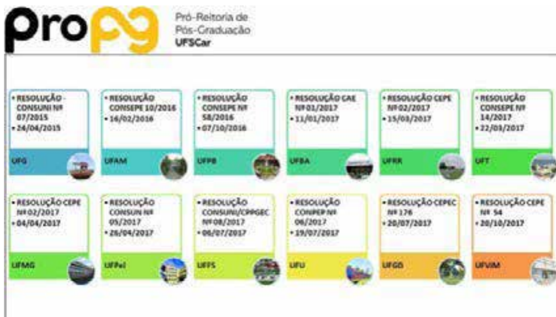
Quadro 1 - Universidades e Institutos Federais que já contam com políticas consolidadas)

Após a Portaria Normativa do MEC no. 13/2016 inúmeras Universidades Federais passaram a aprovar Políticas de Ações Afirmativas institucionais, ou seja, para todos os PPGs. Os dois quadros abaixo, trazem o panorama das Universidades Federais: